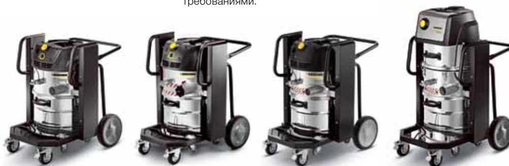
IVC 60/12-1 Tact Ec

Для повышения безопасности при эксплуатации на взрывоопасных участках пылесосы указанного типа оснащены интерфейсом, обеспечивающим передачу сигнала о критическом уменьшении интенсивности воздушного потока.