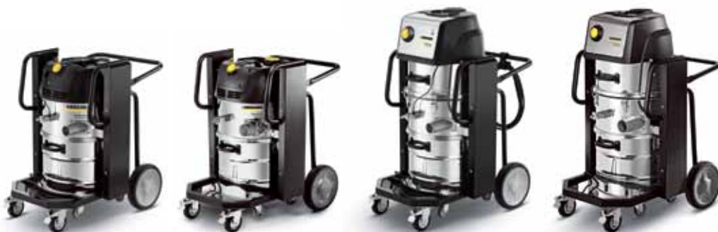
IVC 60/24-2 Tact 2

С двумя тормозами Четырехколесное шасси обеспечивает высокую устойчивость. При этом два передних поворотных колесика, снабженных стояночным тормозом, надежно исключают самопроизвольное перемещение аппарата IVC и облегчают операцию отсоединения мусоросборника.